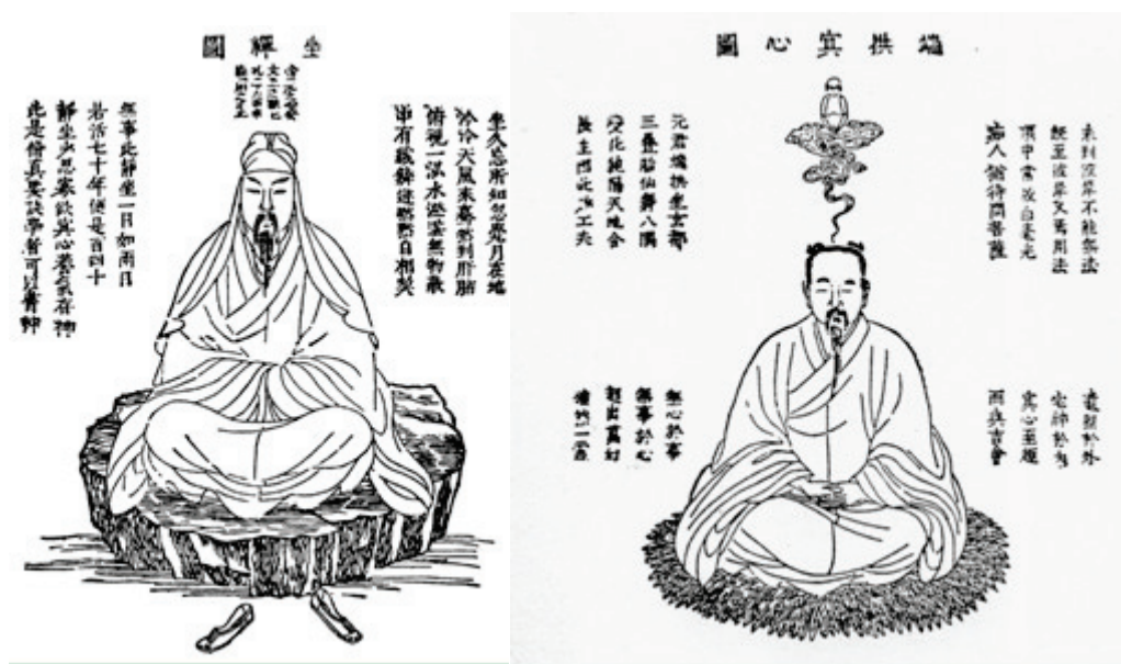
荣格、卫礼贤编《金华秘旨》第一版中的两幅插图

我钦佩东方的伟大哲人，这是毫无疑问的，就像我对那里的玄学毫无敬意一样。我是把他们当做象征意义上的心理学家来看待的；单从字面上来理解他们，则是对他们莫大的不恭。倘若他们所言确是玄学，要去理解他们本来就是无望的。但是涉及心理学的话，我们不但能理解他们，而且得益非浅，因为这时，所谓的“玄学”就是可以把握的了。[25]