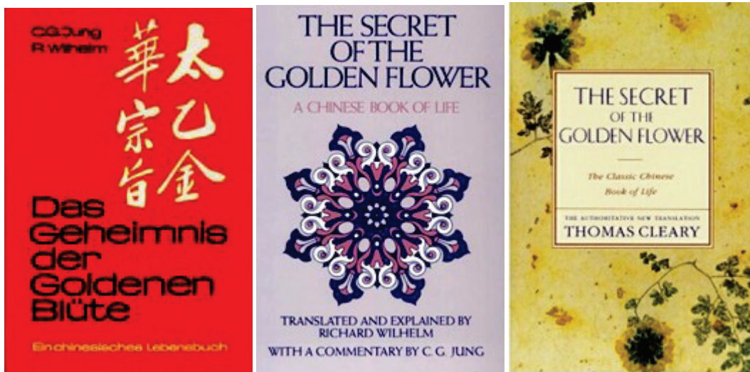
卫礼贤德文译本、贝恩斯英文译本、克利雷英文译本

炼丹术在唐朝全盛时代之后，继续活跃在宋时。后来的许多典籍或文章，看似与炼丹术有关，其实为内丹著述，原因是内丹比外丹更受欢迎。[2]《太乙金华宗旨》这部道教内丹养生功法典籍的成书年代很难定论，今传诸本皆托名唐代著名道士吕洞宾，即吕祖“垂示人间”的降示之作，约有七个版本。[3]该书版本一为净明派系统（后为天仙派），一为全真龙门派系统，并非成于一人之手。1921年由慧真子编辑注释、以《长生术》为名刊行于世的典籍（该版本将柳华阳的《慧命经》改名为《续命方》，合两书为一册），无疑是卫礼贤译本的母本，当属龙门派著述。卫礼贤译本是《太乙金华宗旨》13章中的前9章和《慧命经》20章中的前8章。《慧命经》部分原为卫礼贤的助手所译，由他修订润色，最初发表于卫礼贤主编的《中国科学与艺术杂志》1926年第3卷上。[4]